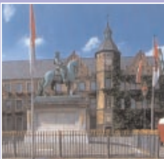
Grüße aus Düsseldorf

„Der einzige Beweis für Fähigkeiten sind Leistungen“